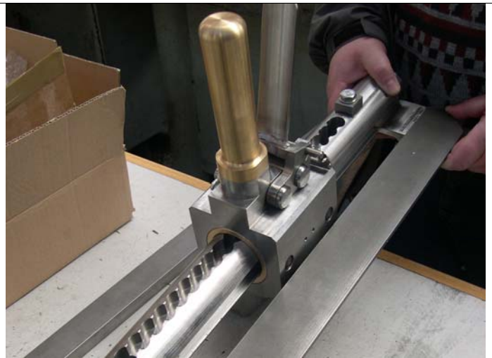
Steuerbock (Baugruppe) angeliefert