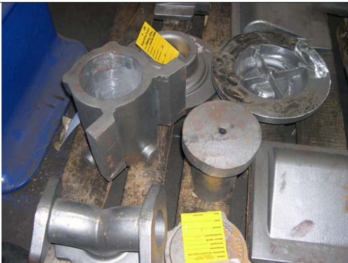
Abstimmung zur Einzelteilbearbeitung von Gussteilen