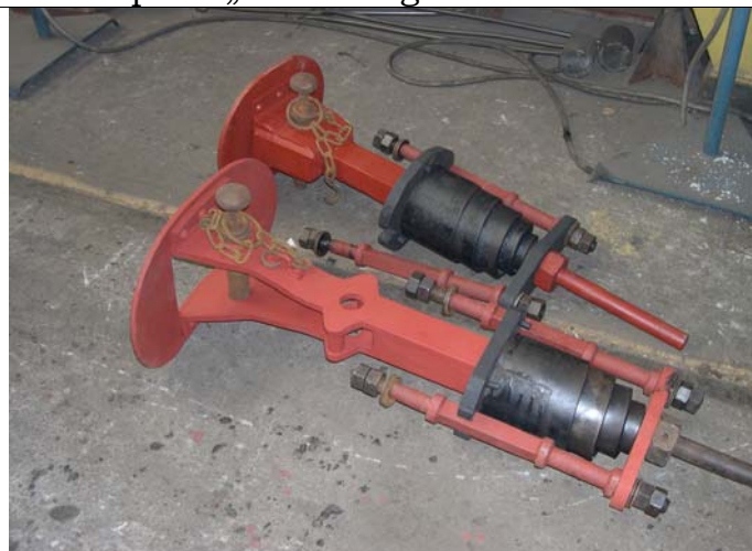
Zug-/Stoßvorrichtung mit Federapparat (angeliefert 3.4.2009)