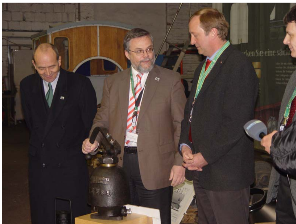
Die Endmontage wird eingeläutet