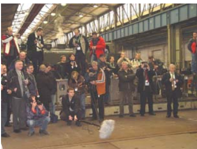
Und das Ganze vor den Objektiven der versammelten Weltpresse