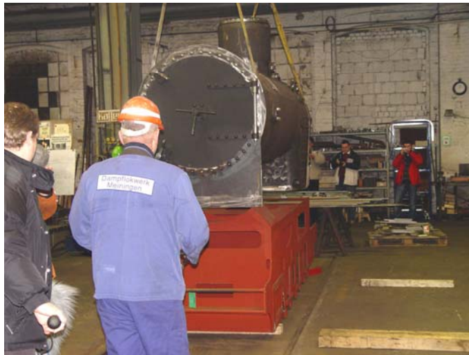
Die „Hochzeit“ von Kessel und Rahmen