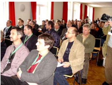
Gespannte Erwartung im Konferenzraum des DLW Meiningen