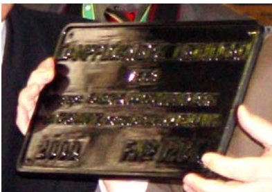
Das Fabrikschild (Die I K trägt die Fabriknummer 204)