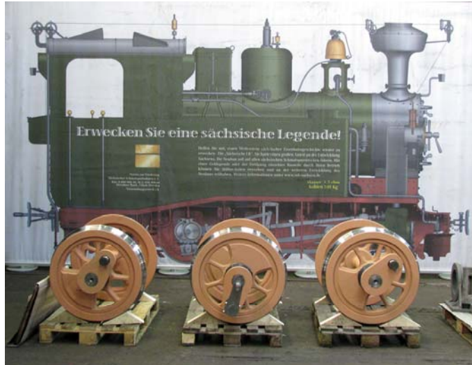
„Als würde sie gleich losfahren ...“