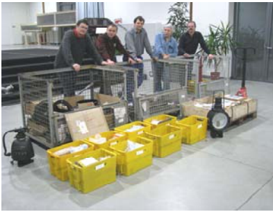
Vorm Abtransport: jedes Teil - gezählt, geprüft, verpackt